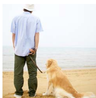
promener le chien