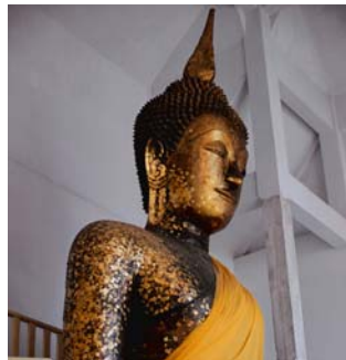
aller au temple