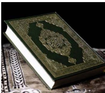
aller à la mosquée