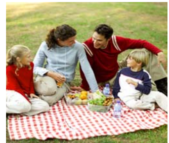
faire un piquenique