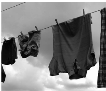
laver les vêtements