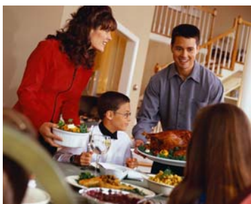
manger en famille