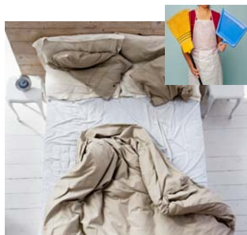
ranger sa chambre