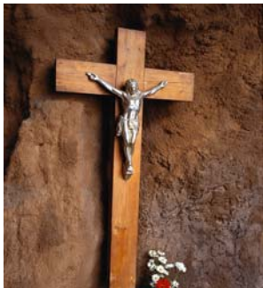
aller à l'église