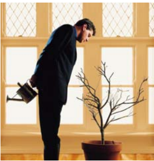
arroser les plantes